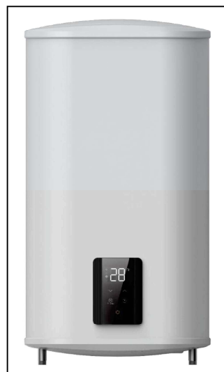
AQ FLATxxx Wifi ErP

A nyilatkozat tárgya / object of the declaration / Gegenstand der Erklärung / Objet de la déclaration / Предмет декларации / Předmět prohlášení / Obiectul declarației: