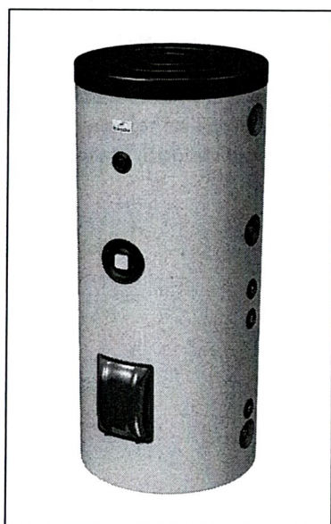
STA ...C sztea

A nyilatkozat tárgya / object of the declaration / Gegenstand der Erklärung / Objet de la déclaration / Предмет декларации / Předmět prohlášení / Obiectul declarației: