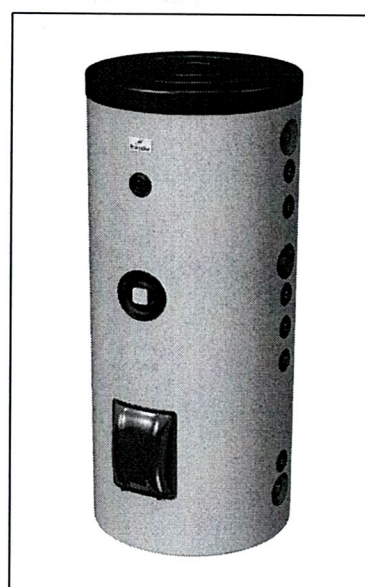
STA ...C2 sztea